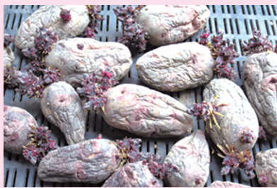
しわくちやのデストロイヤーの種芋

3月に植えたジャガイモを収穫しました。覚えている方もいらっしゃるかもしれませんが、これで大丈夫かと思われるようなしわくちやの種芋でした。でも、数は少ないものの、何とか収穫に辿り着くことができました。