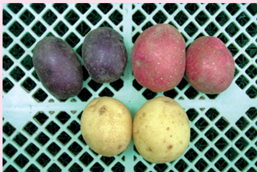
左上：タワラマゼラン 右上：アンデスレッド 下：キタアカリ

ところが、恐ろしいことに畑にチガヤが繁殖し始めたのです。チガヤはイネ科の雑草で、地下茎で増殖します。そのチガヤの芽が、ジャガイモを串刺しにしていたのです！食べるのには影響しませんが、これが農家の売り物だったら、まったく