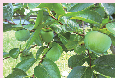
甘柿 (太秋：たいしゅう)