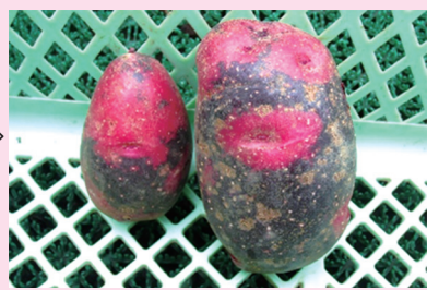
生まれ変わったデストロイヤー