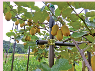
緑のキウイフルーツ (香緑)