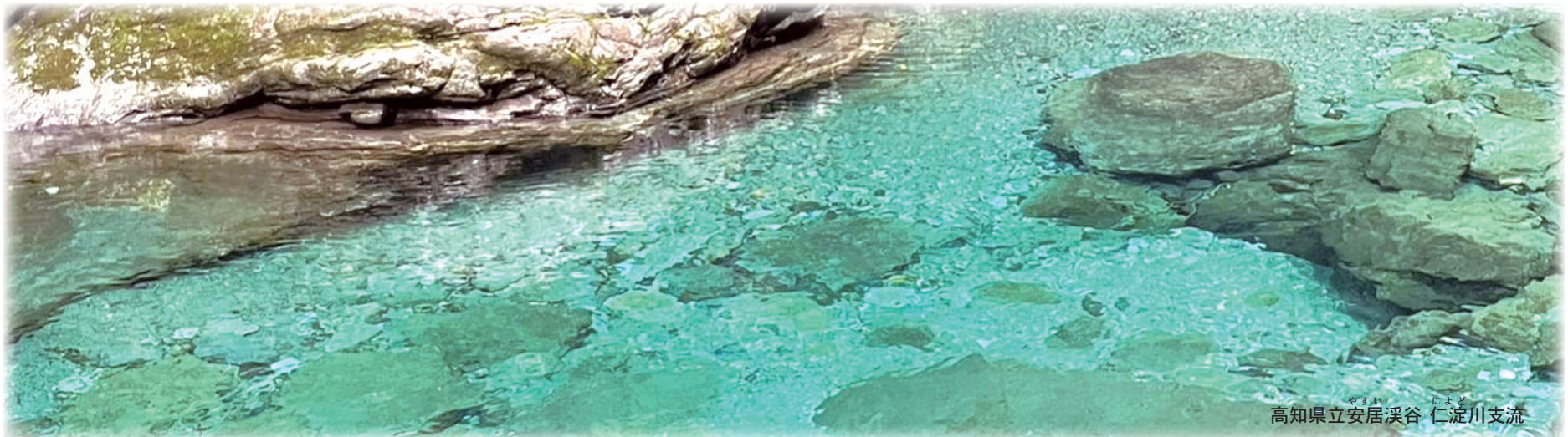
高知県立安居渓谷 仁淀川支流

整形外科・リハビリテーション科・外科・内科(消化器・肛門・乳腺・糖尿病・がん)・漢方内科・小児科